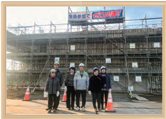
工事現場見学会:成田市北千葉道路