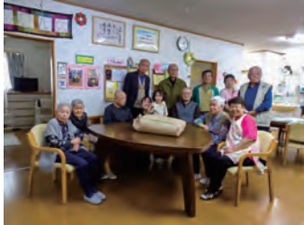
グループホーム「あおぞら」

パーに出かけたり、八幡神社の祭礼にも積極的に参加しています。本須賀にある「憩いの家」では、毎年行われている「本須賀しおさい