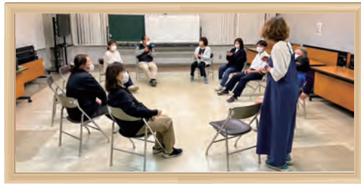
定例サークル活動