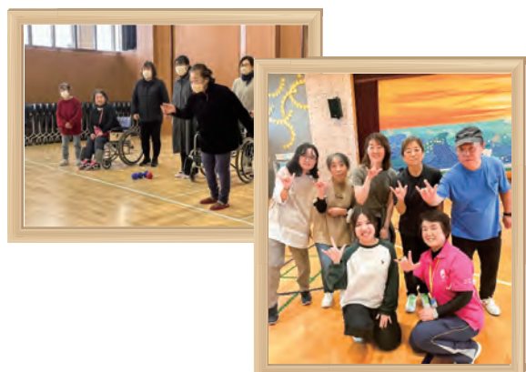
「ひまわり」新年会・ポッチャ大会