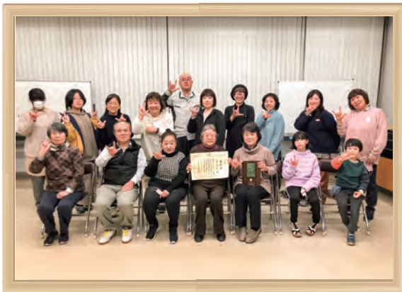
令和4年 千葉県社会奉仕賞受賞