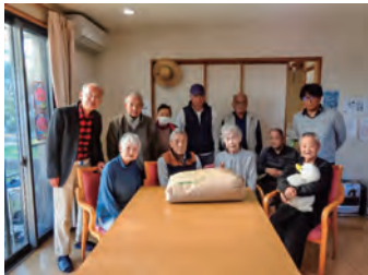
グループホーム「憩いの家」

祭り」に全員が参加し、昨年は元気に太鼓をたたくなどしていました。鳴浜地区社協での訪問活動は長年続いており、短い時間ですが利用者に喜ばれています。以前は推進員が栽培したさつまいもを持参しましたが、その活動ができなくなったため、最近はお米30キロを持参しています。利用者はお米が大好きな方が多く、大変喜ばれています。2つのグループホームの方々も鳴浜地区の目標となる支援を必要とするすべての住民の一人です。これからも鳴浜地区で自分らしく生活できることを期待します。