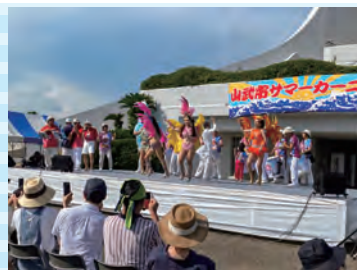
特設舞台上で「サンバの踊りと音楽」をお披露目! 道の駅「おらい連沼」付近から見た花火