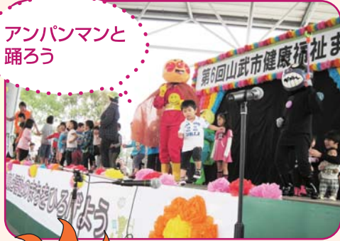
アンパンマンと踊ろう

野外ステージや福祉関係団体等による模擬店のほか、子どもから高齢の方まで誰もが参加し楽しめるイベントをスタッフが企画しています。