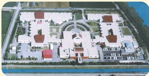
緑海会全景(左側：光洋苑/中央：管理棟/右側：青松苑)