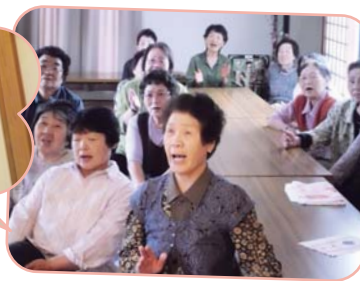
マジックショーでびっくり!!