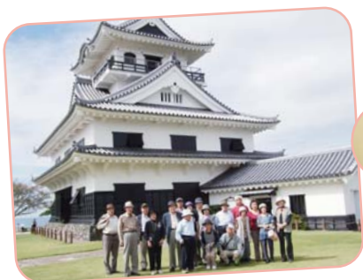
おでかけで、リフレッシュ!

参加してみたい！企画してみたい！どんなことなのか知りたい？など、興味のある方は社会福祉協議会までお問合せください。