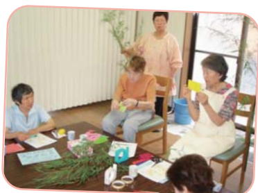
天の川に、願いを込めて