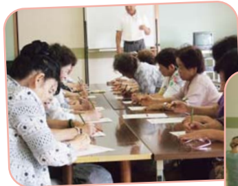
頭の体操、体の体操、健康第一!!