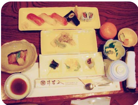
どれもおいしそう…。