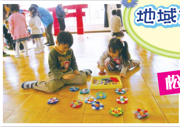
手づくりのコマはきれいだね