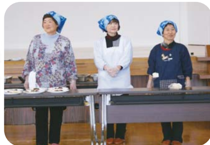
ボランティアさん お揃いのバンダナがステキでした