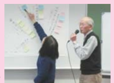
グループ発表でのひとこま

受講された方からは、「種々の新情報を得ることでき、本当に良かった」「もっと山武市の街づくりの方向性を勉強したい」「これからもこのような講座や地域活動に参加していきたい」などのご意見をいただきました。