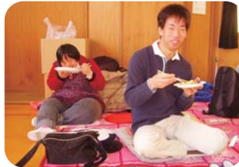
自分でついたお餅は最高