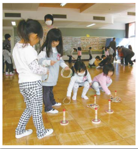
わなげっておもしろいね