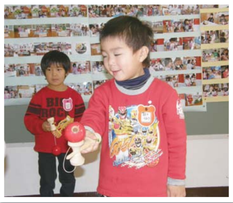
ぼくにもできたよ