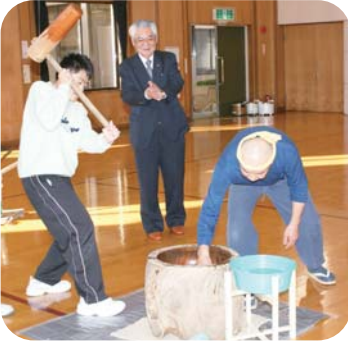
気合とともにヨイショ

“もちつき” 初体験の利用者も多く、「私もちつきたい！」と、長い列が出るほどでした。