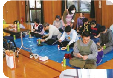
みんなで食べるとおいしさ 2 倍

その後は、「3 作業所対抗玉入れ合戦」を行い、会場には、笑顔があふれていました。