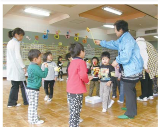
じょうずに回るかな？

毎年、定例行事となつてきている世代間交流事業としての昔遊び。今年も3歳児、4歳児を対象に盛大に行なわれしました。外はまた寒気おさまらない中、園内は熱気に包まれていました。 まつお認定こども園には0歳から5歳までの園児たち約130名が在籍しています。毎日、元気いっぱいにお遊戯や花づくり、外遊びなど楽しい活動を展開しています。園児たちの中でも、とりわけ3歳児、4歳児は元気な子どもたちばかりでした。 男の子は、こま回しや竹トンプボ、風ぐるまに興じていました。女の子は、おはじき、万華鏡、あやとりを