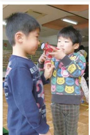
みてみてキレイだよ