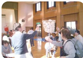
優勝はこの作業所？