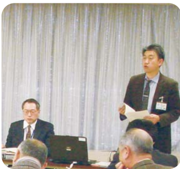
災害の実体験をお話くださいました