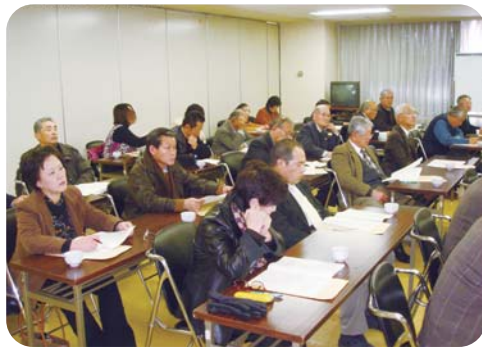
どれも心に響くお話でした

地区社協、介護関係の仕事をする皆さんが、自己の安否を確認しあつた後、直ちに災害弱者に対する安否確認に動き出し、被災から3日間で全員の安否が確認出来たことや、3ヶ月前の新潟・福島豪雨災害の経験が生きたと話していました。地震発生翌日には災害ボランティアセンターを開設し被災された住民のニーズにこたえてサポートし不安をやわらげる活動をした等々大変参考になりました。