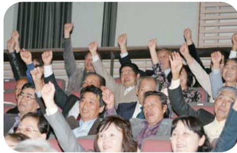
▲空に向かって“パ～ンチ”