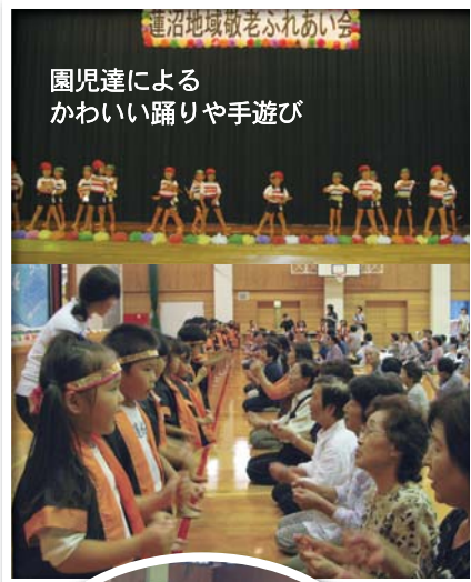
園児達による かわいい踊りや手遊び

5 回蓮沼地域敬老ふれあい会」が180名程の参加を得て開催されました。 秋の刈り入れも済んで一段落した人や、この敬老会を楽しみに待っていてくれた人達が「お久しぶりー」「お元気でしたか」などとあいさつを交わしながら和やかな雰囲気の中で会が始まり、蓮沼保育園児80余名によるかわいらしいお遊戯や手遊びが発表され、おじいちゃん・おばあちゃん達も参加して「大きな栗の下