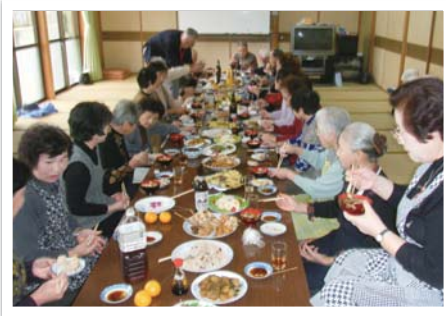
Bブロック食事会 美味しいご馳走が並んでいますね

仕事のため靴に合わせて履いていた右足。60歳になってからは自由に体に合わせた靴を選び、できるだけ下駄を履き5本指の靴下で指を1本ずつ自由にしています。