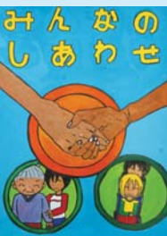
伊庭 菜奈子 (成東小6年)