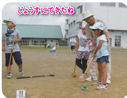
じょうずにできたね