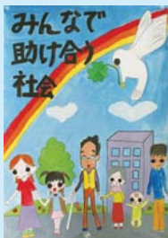
渡邊 美津貴 (鳴浜小5年)