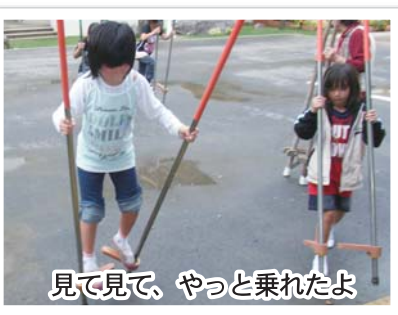
見て見て、やっと乗れたよ