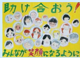
西谷 美乃里 (南郷小6年)