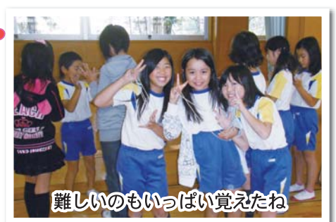
難しいのもいっぱい覚えたね

は大人になっても良い思い出になることでしょう。私達指導員も一緒に楽しみ共に喜びを共感した一日でした。来年もまた開催していただけることを願っています。