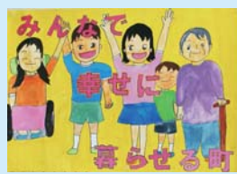
奥本 紗代 (日向小6年)