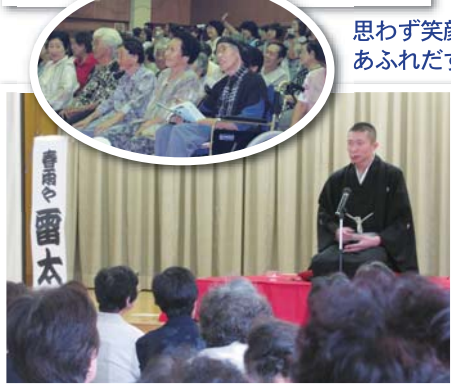
期待の若手落語家!!