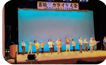
芸能・カラオケ大会 成東文化会館