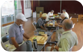
囲碁・将棋大会 成東老人福祉センター