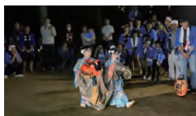
お囃しと3地区の頭出し