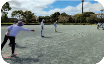
スポーツ大会 ペタンクの部 成東運動公園

ご入会のお申し込みは 山武市ゴールドクラブ連合会 電話 0475-82-7102