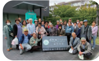
親睦旅行 造幣局さいたま支局 見学など