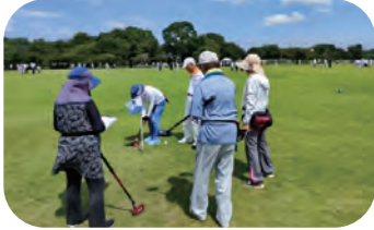
スポーツ大会 グラウンドゴルフの部 成東運動公園

活動の魅力 ・新しい仲間ができる・健康の保持増進になる・知識や経験が活かせる ・心の安らぎ、充実感が得られる・地域社会への貢献ができる