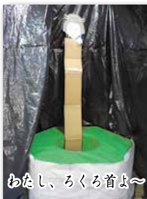
わたし、ろくろ首よ〜