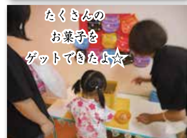
たくさんのお菓子を ゲットできたよ☆