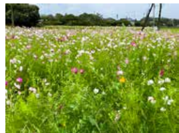
工業団地入口交差点付近の様子