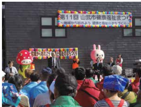
※写真は平成28年度のものです。