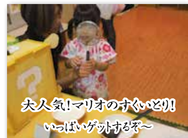
大人気!マリオのすくいとり いっぱいゲットするぞ〜

子ども達の大好きなキャラクターが大集合でした( ^o^ )/ 最後は、みんなが大好きな(?)お化け屋敷を行いました。 子ども達の絶叫と保護者の方からの「怖かったー！」と いうお褒めの言葉を励みに、来年はもっともっとパワーア ップ出来るよう頑張ります！！