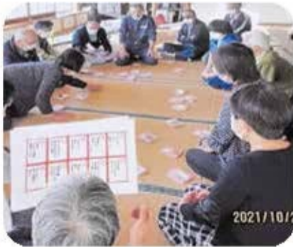
↑防災かるたの開始です↓