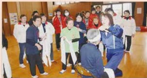
三角巾を使った救急法講習

【お問い合わせ】山武市赤十字奉仕団事務局(山武市社会福祉協議会内) 住所：山武市白幡1627番地 電話：0475(82)7102