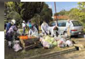
災害ゴミの片付けボランティア