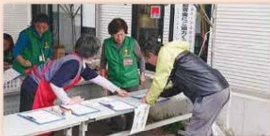
災害時にボランティア受付を行いました。

現在、一緒に活動してくれる団員を募集中です！関心のある方は、ぜひ事務局までお問い合せください。ご連絡お待ちしております！