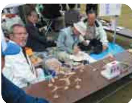
▲ゴールドクラブの竹とんぼ作り

また、共同募金の募金箱設置にご協力いただきました出店者の皆さまありがとうございました。12店、合計15,459円の募金をいただきました。協力各店のご紹介は、他の募金活動と併せて次号で詳しくご報告させていただきます。