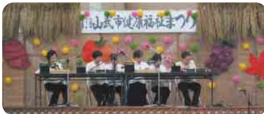
▲ステージではいろいろなグループの発表がありました