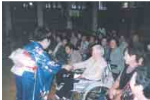
▲握手してもらい感激!