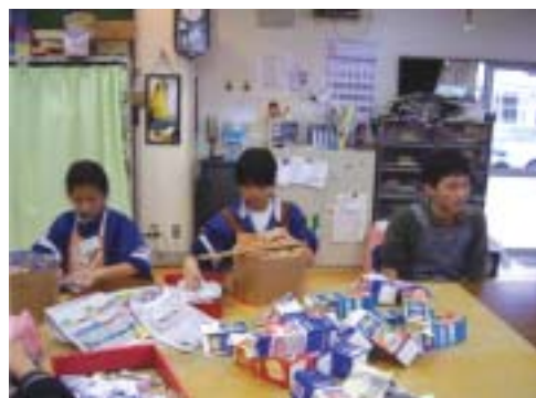
リサイクル椅子の製作風景

平成 20 年度も山武南中学校から 2 名、山武中学校から 3 名の生徒さんを受け入れました。はじめて障がいを持った方とふれあう経験をする方もおり、地域の若い方に障がいについて知っていただく貴重な取り組みだと考えています。また作業所の利用者の方々にとっても地域の若い方たちとの交流は、非常に刺激を受ける取り組みであります。今後ともこのような取り組みが継続して行われ、多くの中学生の皆さんに作業所へお出でいただきたいと考えています。