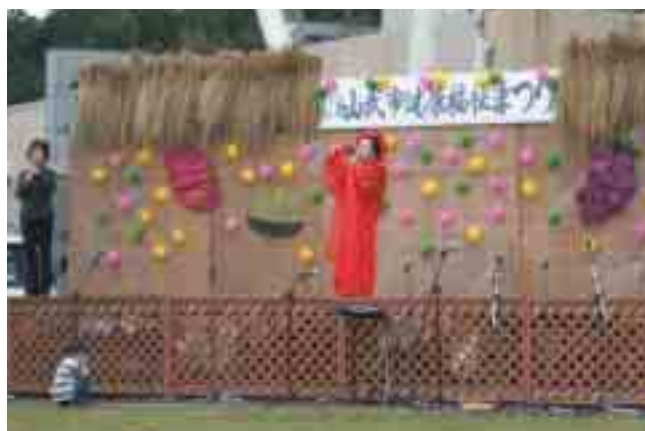
▲メインゲスト大空ひばりさんの熱唱!