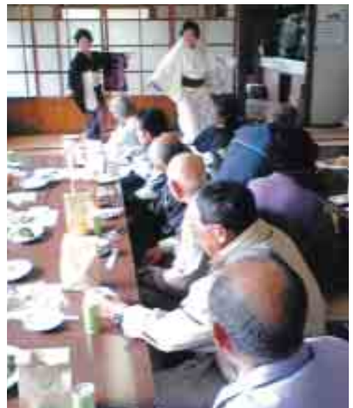
▲あでやかな踊りにうっとり