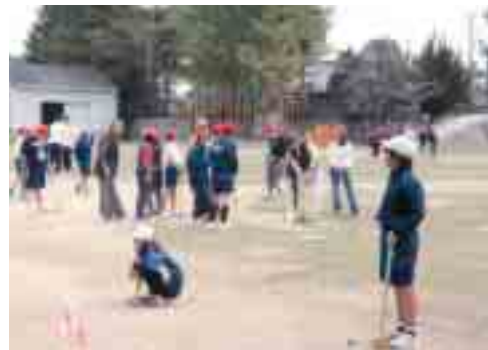
▲グラウンドゴルフで交流

11時過ぎに閉会となりました。推進員にとつても、孫や近所の子供も多く、あちこちで歓声が上がりがなごやかな中に子供から元気をもらい少し若返ったような一時でした。さすがに子供は上達も早く驚かされました。皆素直な子で中学生になっても頑張つてほしいと思えました。来年もまた行なわれると思いますが、学校と相談して内容を充実して行ければと思っています。