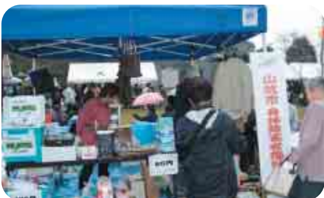
▲障害者団体も出店しました