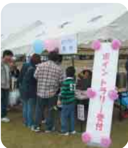
▲お楽しみ抽選に参加

10月26日、さんぶの森公園を会場として3回目の『山武市健康福祉まつり』が開かれました。今年も会場を変えての開催となりましたので、運営・企画実行スタッフの打ち合わせも入念に行われ、準備は一丸となつての作業となりました。