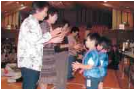
▲おばあちゃん こんにちは!