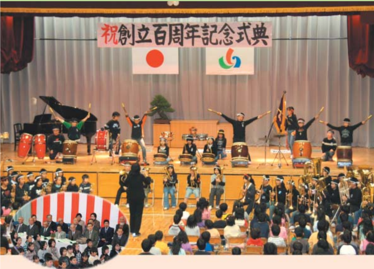
▲記念誌の編集協力員