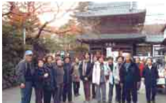
▲紅葉の高尾山 泉岳寺参拝の旅

る炉端焼きで煙りに満ちた昼食を取り、二路高輪の泉岳寺へ向いました。赤穂義士の墓所には線香の煙りが漂い、各々には名前、戒名、年令の刻まれた小さな墓石が並んでいました。三百年前に打入りがあったなんて想像もできませんが、墓石も質素で戒名からも時の幕府に対する配慮が伺われるようでした。