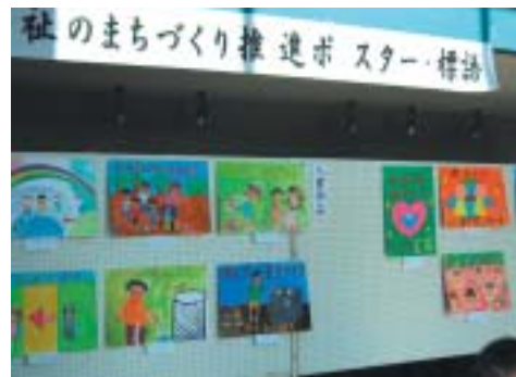
▲会場に展示されました。