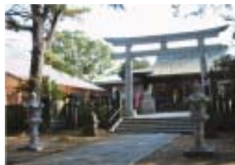
(写真上) 新春の光を浴びて、遷座八十年記念事業として新装なった八田の金刀比羅神社参集殿が燦然と輝いている。

△大金融危機の尾を引いて迎えた平成21年(丑年)だが、山武市民のきずなも一層深まり、合併効果が福祉の面に花開くことを期待したい。福祉に限らず、何事も一年一年の積み重ねが重要だ。福祉大会や健康福祉祭り、地区社協の活動報告など、貴重な足跡を深く脳裏に刻み込んでおきたい。△今年も先行き不安が先行し、文字通り「牛歩の歩み」となるかも知れない。しかし、真心を込めた福祉の歩みが本誌を通して多くの人の心を潤し、市民のきずなとして踏み固められていくに違いない。 △新年を迎えた市内の神社等では多くの市民が参拝し、平和の祈りを捧げている。私も福祉の芽が芽吹くように祈りたい。 (大津)