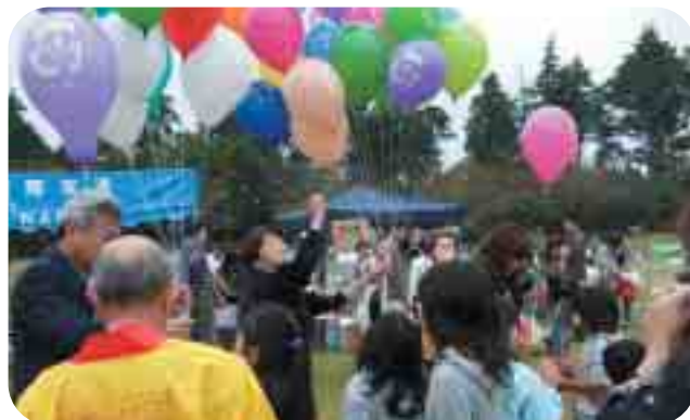
▲共同募金運動で風船を配布