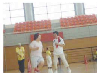
・スポーツ大会参加