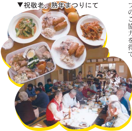
▼祝敬老、熟年まつりにて

ら資金を出していただいています。同じように地区社協からも補助金を出しています。北地区は、5ヶ所の地域で構成されていますので、平等に地域に補助をし