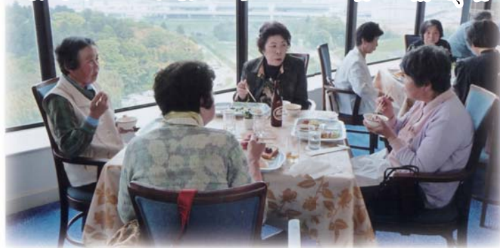
▲ホテル高層階でのバイキングは最高!

満開に咲きほこるつつじもあり、みんなの目を楽しませてくれ岬から見渡せる田園風景は素晴らしいものでした。