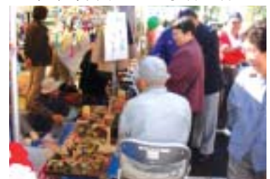
▲竹トンボの手作りは男性会員