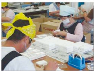
・化粧パウダ入れ