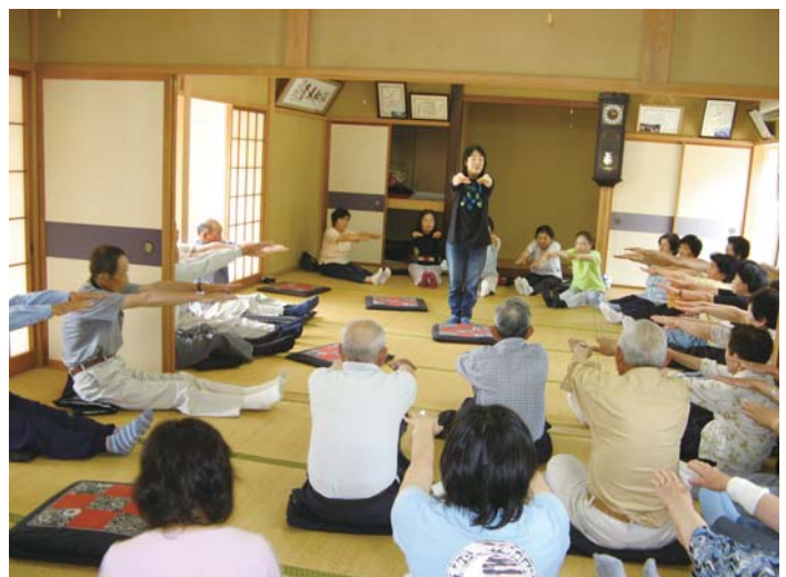
▲運動で骨を育てよう!

大平地区社協が計画しているふれあいサロンは、年4回。今回は下之郷地区。福祉推進員が足で呼びかけて参加していただいたメンバーは、3組のご夫妻を入れて27人。