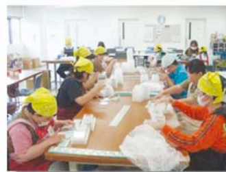
・野菜パックシール貼り