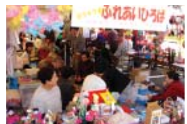
▲女性部会による手作り作品