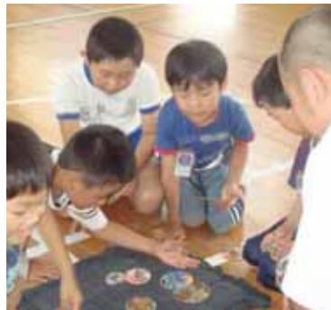
▼「めんこ」ってむずかしいね！

き「来年もよろしくお願ひします。」と早くも次の楽しみに心をはせています。今年は1、2年生の「昔遊び」は6月27日に実施し、3、4年生の「グラウンドゴルフ」は10月17日、5、6年生は11月11日を予定しています。（櫻井久子）