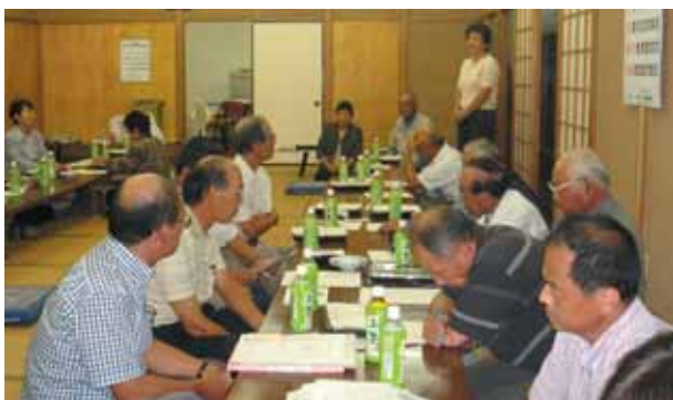
▲座談会で意見発表、市民の声を計画に!!

※各地域でおこなわれる座談会では、昨年度ご提言いただいた課題についての協議がおこなわれます。また、協議課題は地区によって違いますので事前にご確認ください。