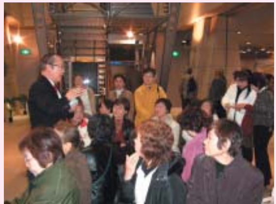
▼東京都本所防災館での研修

日本赤十字社千葉県支部山武市地区 (山武市社会福祉協議会内) ☎(0475)82-7102