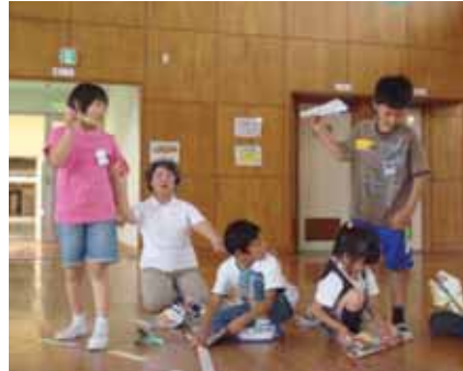
▼どこまで飛ぶかな？

又、新聞の折り込み広告を利用して紙飛行機を折り、どこまで飛ばせるか競争してはりきり、私達もついつい夢中になってしまいます。けん玉を上手に見せてくださるおじいさんに子供達は目を丸くして感心しています。