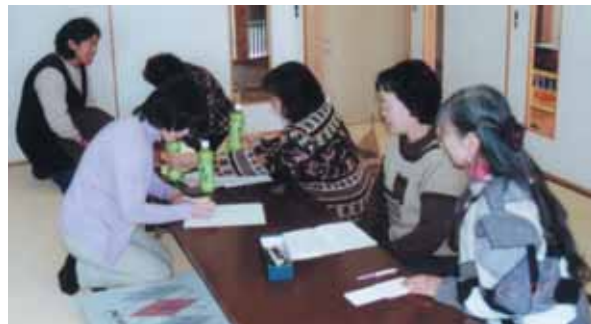
▶アンケートに回答

この地区では、秋まつりの準備会に合わせ、地域住民、行政連絡委員、まつりの役員それぞれの立場の方から、意見、要望が出されました。又、まつり当日集まる人(年齢層広く)を対象とした、100人アンケート“多くの方の声も聞くことが出来ました。”