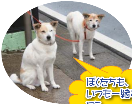
ぼけちも、いつも一緒だわ