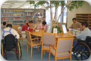
レクの時間に図書館で読書