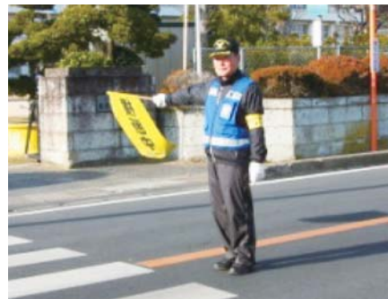
▲防犯パトロールのベストがお似合いです

ただ残念なことは、『不心得運転者が未だに後を絶たない!』、ということだそうです。