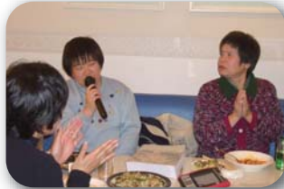
12月25日クリスマス カラオケ大会