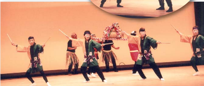
山武市代表チーム五和会の舞踊「御陣乗太鼓」