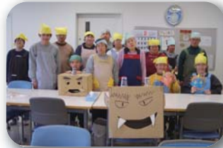
2月3日節分の豆まき 1年間無事にすごせますように