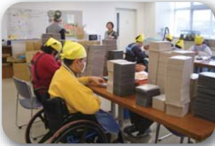
製品の組み換え・袋入れ