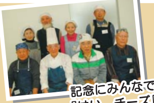
記念にみんなで『はい、チーズ』

アボなし取材にもかかわらず、春のぼかぼか陽気のようにみなさんが温かく迎えてくれました。