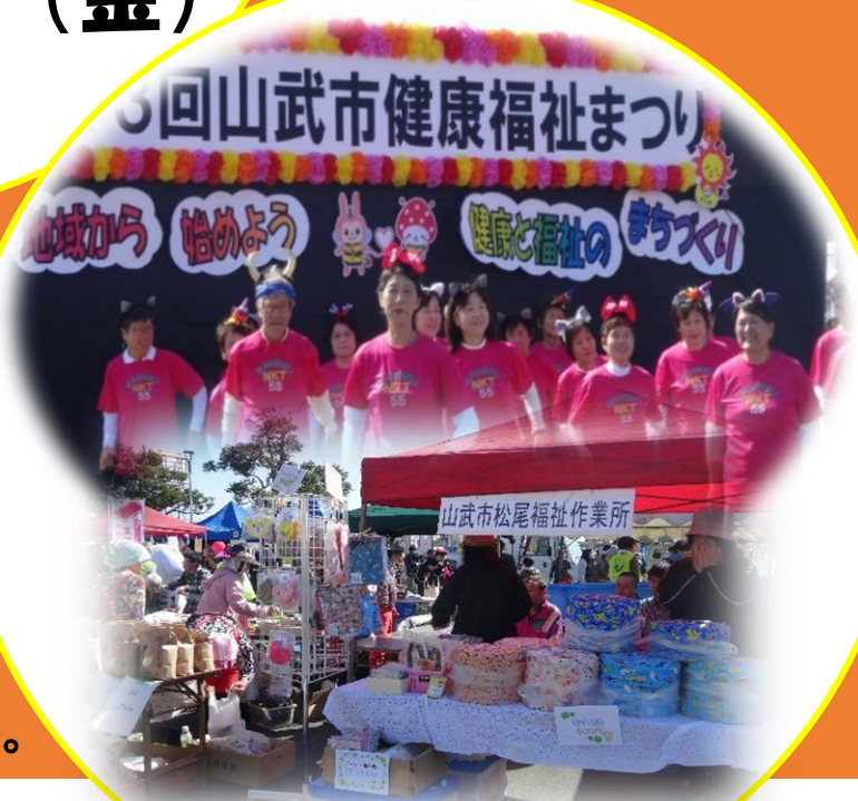
過去の健康福祉まつりの様子