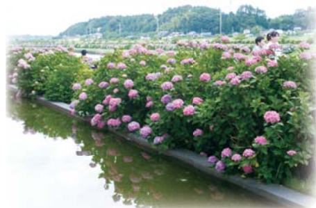
▲多古、道の駅「栗山川」アジサイ