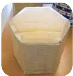
▲上と下にダンボール紙を貼る