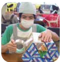
▲側面を布テープで張る