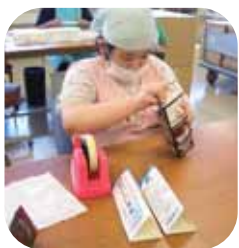
▲三角柱を作りテープでとめる