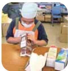
▲牛乳パックを切り開く

今回は松尾福祉作業所で作っている牛乳パックを利用したのリサイクル椅子製作の様子を紹介します。