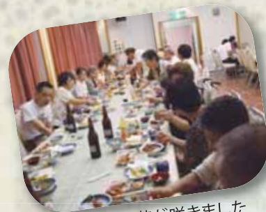
話に花が咲きました

問合せ先: 山武市身体障害者福祉会事務局 (山武市社会福祉協議会内) ☎0475(82)7102