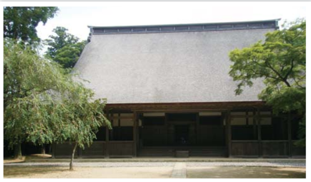
▶飯高寺（飯高壇林）全景

一人暮らし高齢者と推進委員の親睦日帰り旅行で今年日本が一番古い大学を調べてみることにしました。 7月6日お天気は心配なく朝から快晴で出発時間「午前9時」には47名全員集合。2台のバスに分乗し、元気に出発。 車中では久しぶりに会った友達同志でにぎやかに笑顔の会話がはずんでいました。 まもなく日本で一番古い大学の前身地に到着しました。この寺院は、旧八日市場市の中心より北方へ約8キ