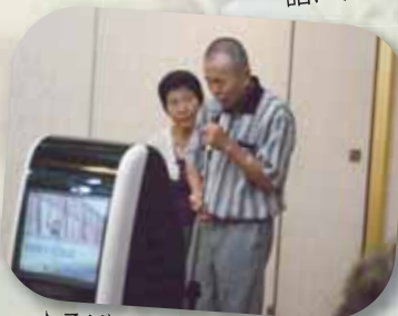
♪そばにいて くれるだけでいい♪