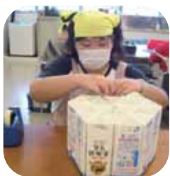
▲24本組合せ六角形にする