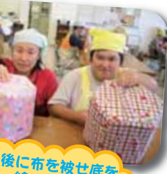
最後に布を被せ底を縫って完成!